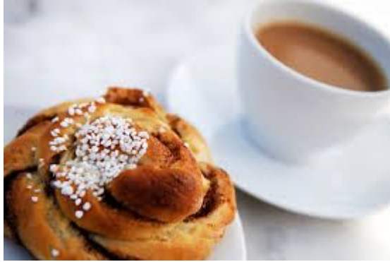
Fika med kaffe och fikabröd